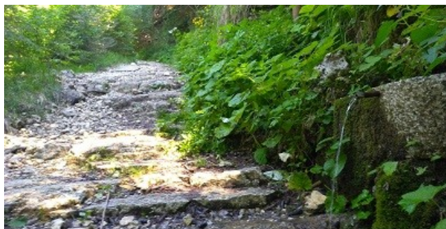
fontana degli Alpini

Il ritrovo è al ponte dell'Anguillara (in fondo al vajo fra Erbezzo e Bosco Chiesanuova) alle ore 10. Si risale inizialmente il vajo dell'Anguilla poi si segue una valle laterale, vajo dei Modi, per un sentiero non difficile e ombroso; infine si lascia il fonfovalle e si risale verso malga Lessinia dove ci sarà la sosta pranzo (al sacco) ma si potrà probabilmente prendere anche il caffè o