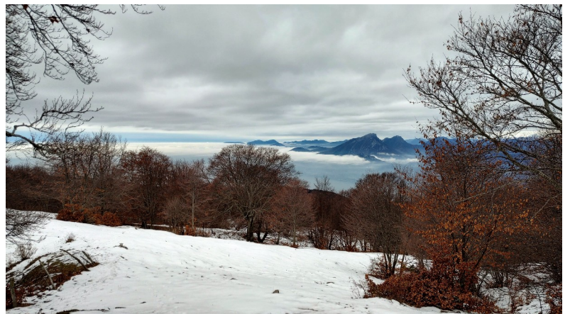
Dalla cresta di Naole