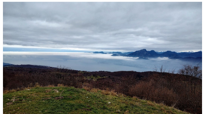
Da malga Pralongo