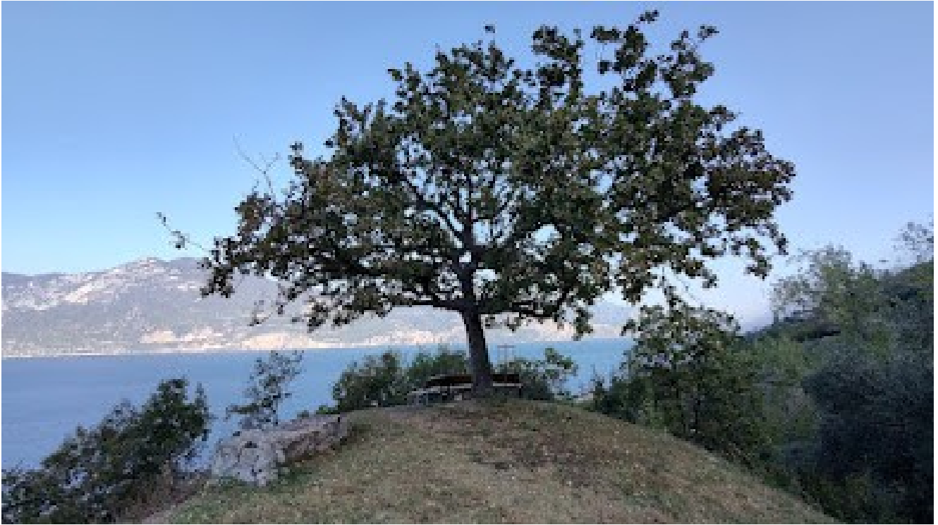
La quercia dell'Amore