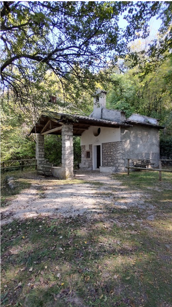
S.Antonio delle Pontare