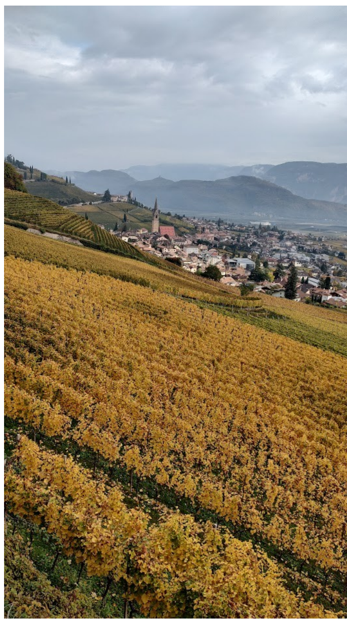
i vigneti sopra il paese di Termeno