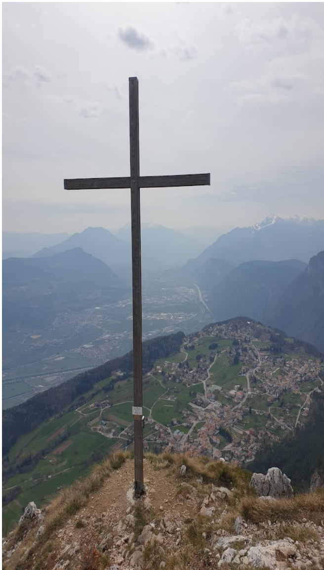
La Croce di Fai