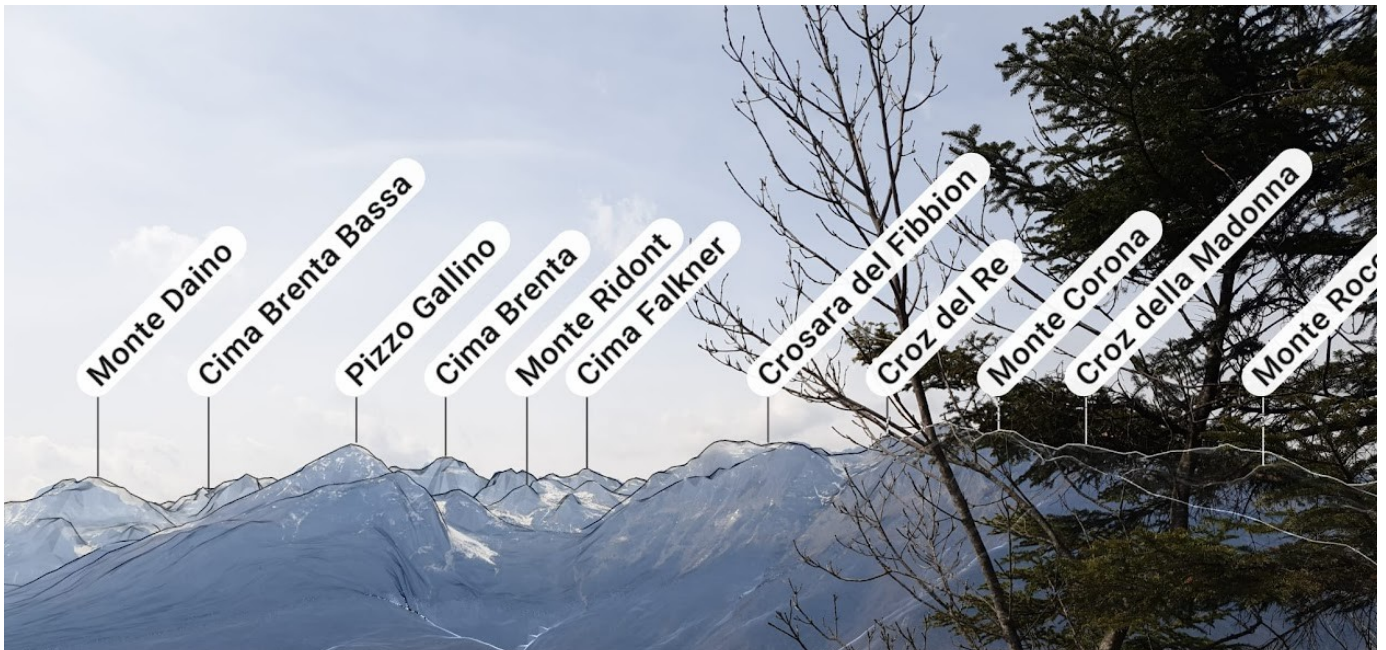
Punto panoramico sopra Santel