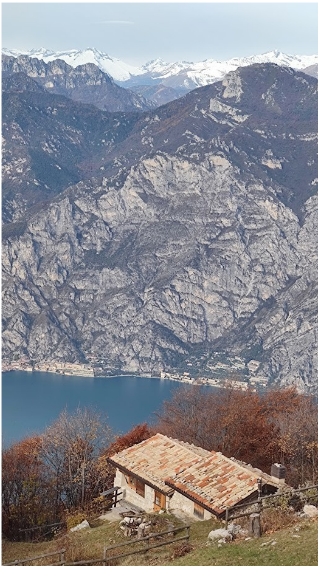
Bait del Vo'