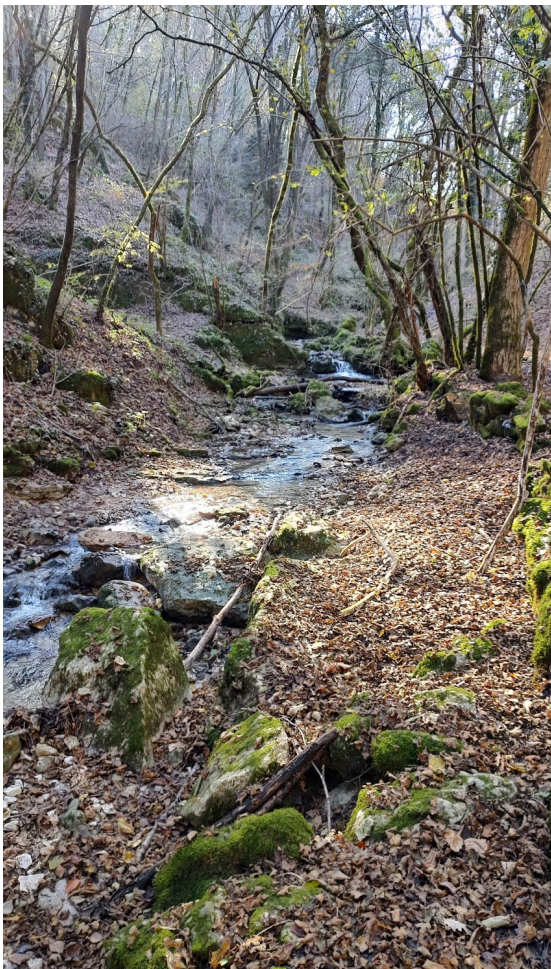
Lungo il Vajo