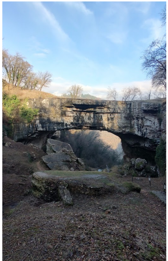
Ponte di Veja