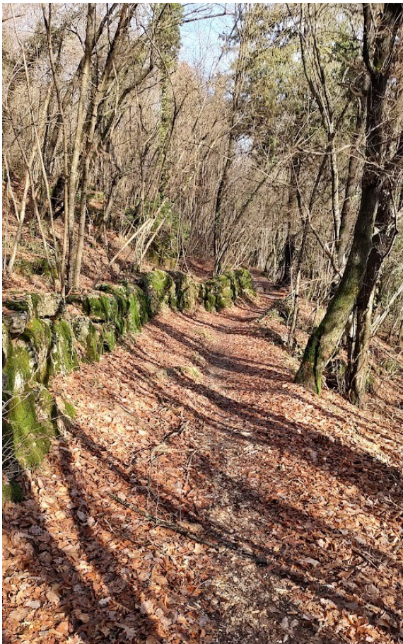
Sentieri di Pozze