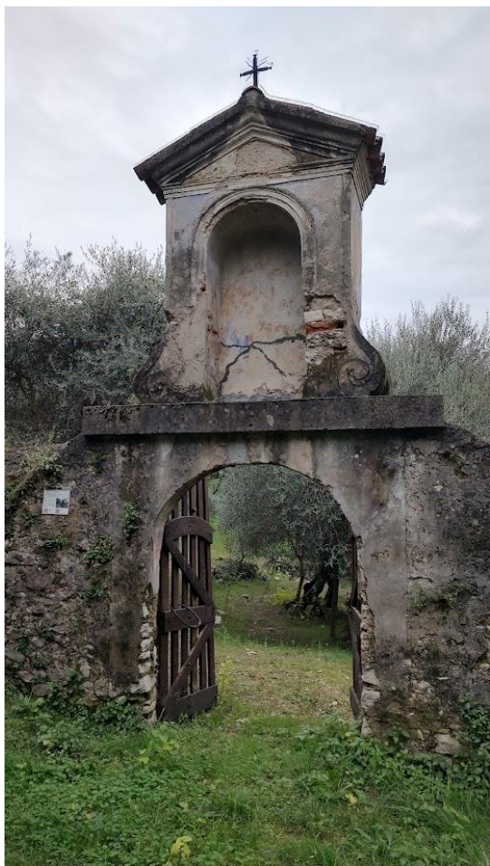
Uno dei capitelli lungo il sentiero