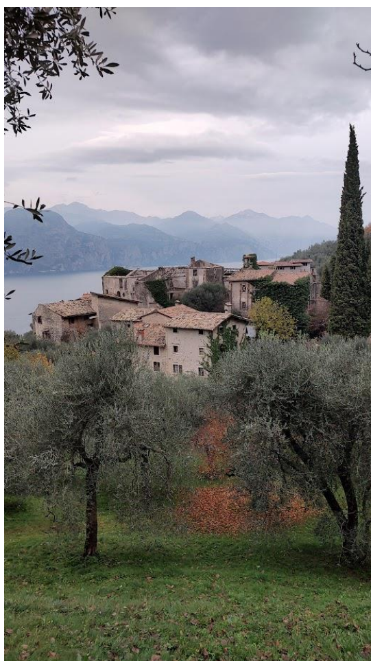
il borgo medievale di Campo