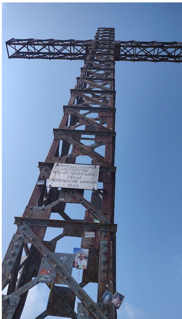
la croce di Pizzo Formico